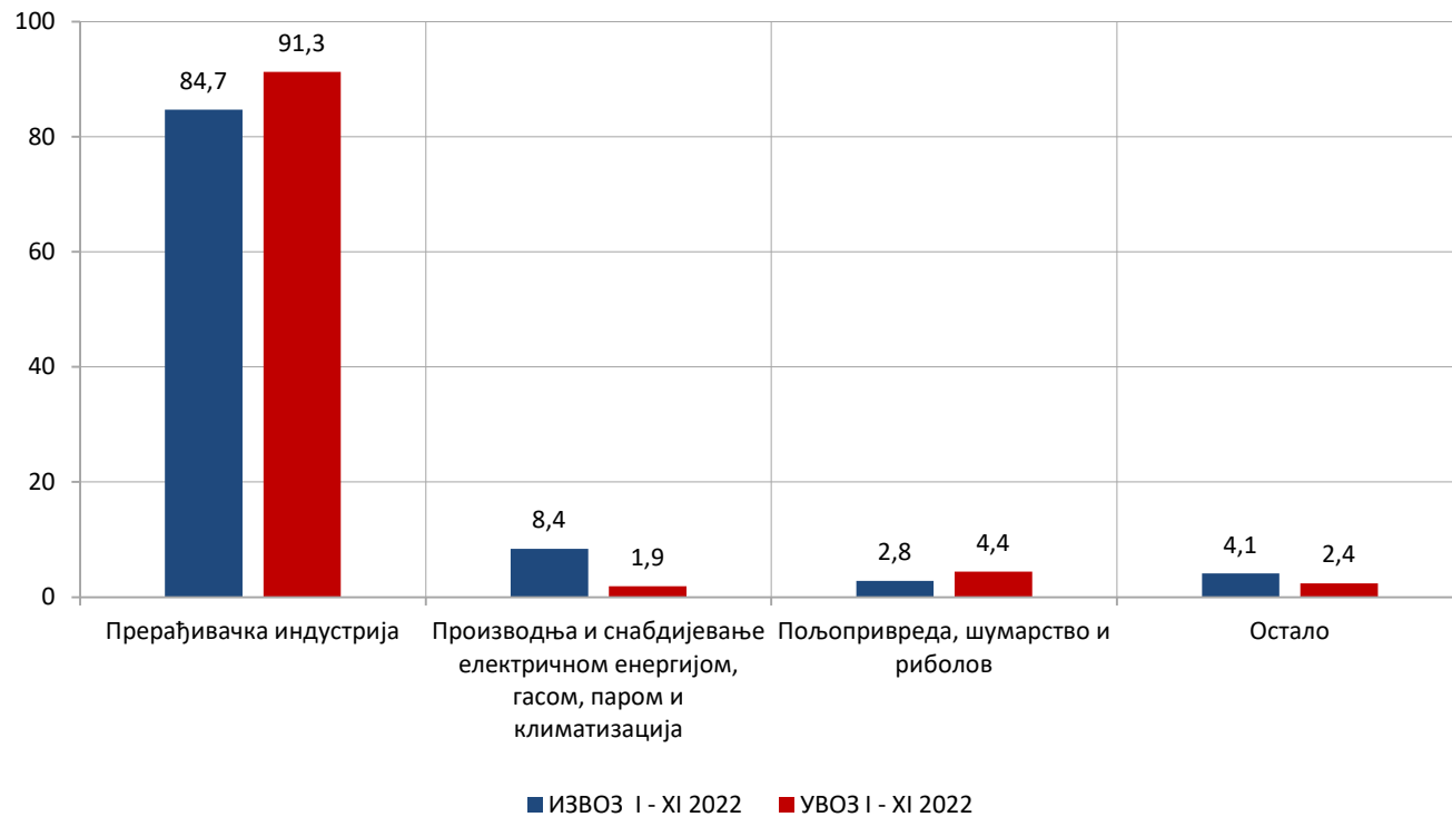
Графикон 1. Структура извоза и увоза према класификацији дјелатности