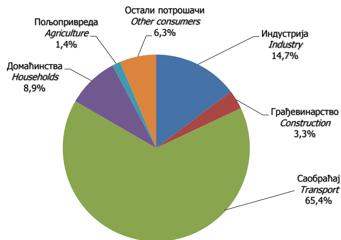
Графикон 2. Финална енергетска потрошња деривата нафте, 2012. година Graph 2. Final energy consumption of petroleum products, 2012

Саопштење припремила: Рада Липовчић e-mail:rada.lipovcic@rzs.rs.ba