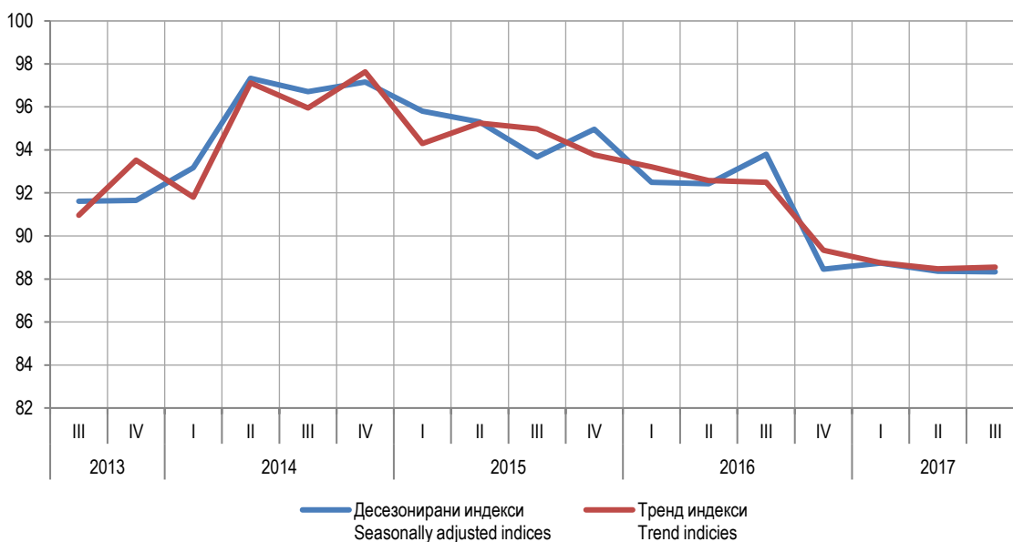
Графикон 1. Индекси производње у грађевинарству, III тромјесече 2013 – III тромјесече 2017. Graph 1. Indices of production in construction, 3 rd quarter 2013 – 3 rd quarter 2017