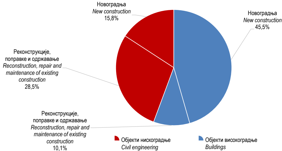
Графикон 2. Структура извршених ефективних часова према врсти радова, II тромјесечје 2021. Graph 2. Composition of performed effective hours by type of work, 2 nd quarter 2021