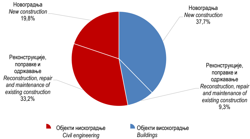
Графикон 2. Структура извршених ефективних часова према врсти радова, IV тромјесечје 2021. Graph 2. Composition of performed effective hours by type of work, 4 th quarter 2021