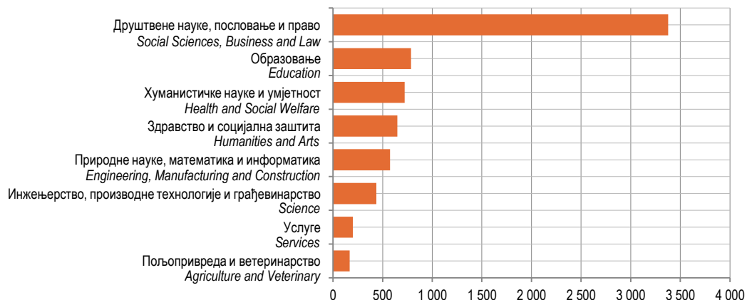
Графикон 3. Дипломирани студенти према области образовања у 2013. години Graph 3. Graduated students by field of study in 2013