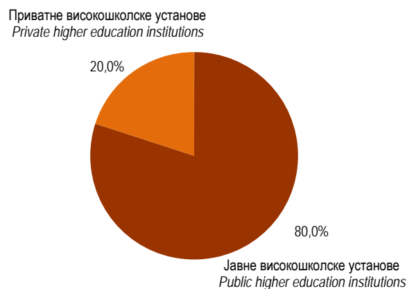
Графикон 2. Докторанти према врсти високошколске установе у 2016/2017. години Graph 2. Doctoral candidates by type of higher education institutions in the academic year 2016/2017