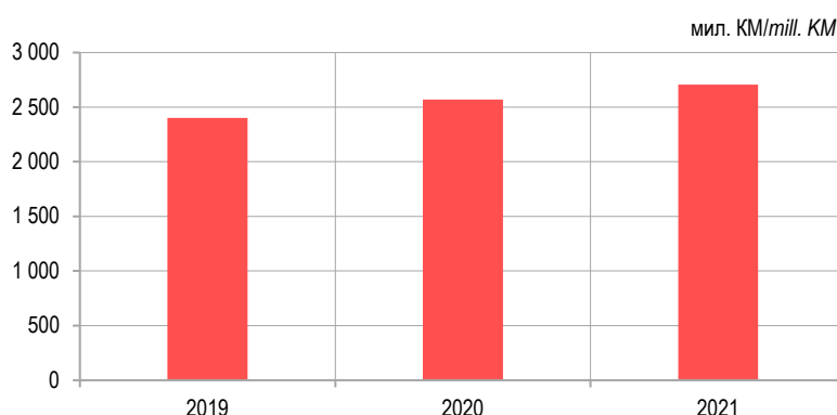
Графикон 1. Укупни издаци социјалне заштите Graph 1. Total social protection expenditures