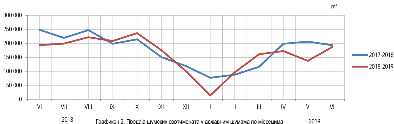
Графикон 2. Продаја шумских сортимената у државним шумама по мјесецима Graph 2. Sale of forest assortments in state forests by month