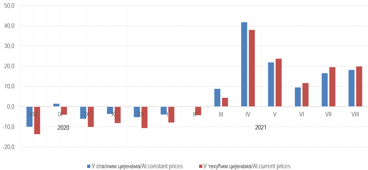
Графикон 2. Годишње стопе промета трговине на мало, календарски прилагођена серија Graph 2. Annual rates of turnover in retail trade, working-day adjusted series