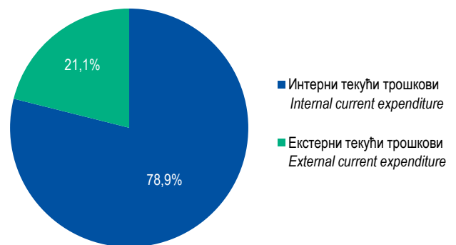
Графикон 3. Структура текућих трошкова за заштиту животне средине, 2022. Graph 3. Structure of current environmental protection expenditure, 2022

Саопштење припремила: Стана Копрановић email: stana.kopranovic@rzs.rs.ba