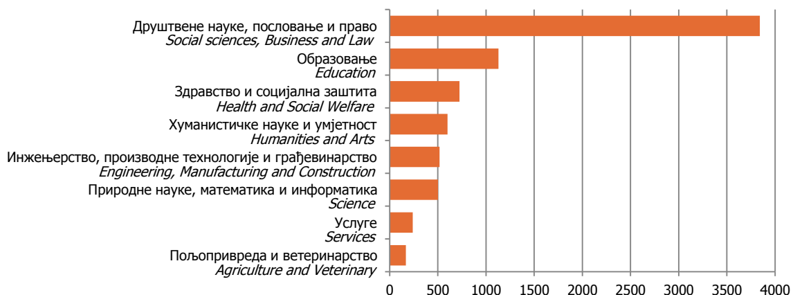
Графикон 3. Дипломирани студенти према области образовања у 2011. години Graph 3. Graduated students by field of study in 2011