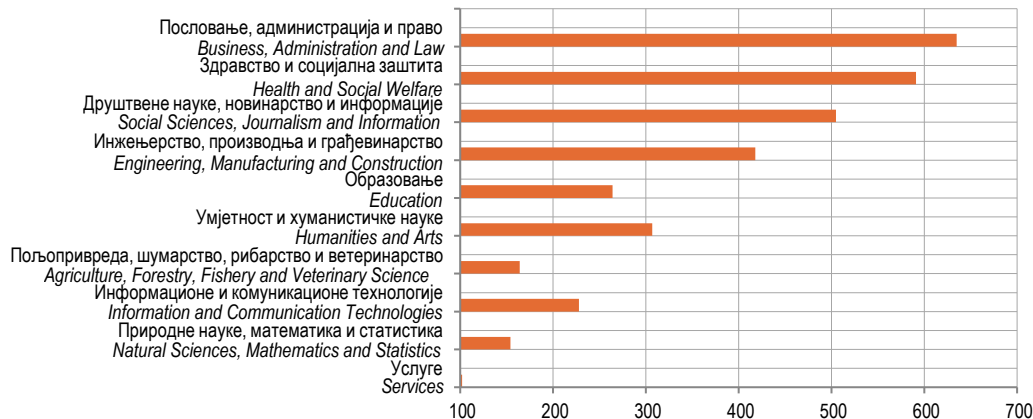
Графикон 3. Дипломирани студенти према области образовања, 2022.

Graph 2. Graduated students by age, 2022