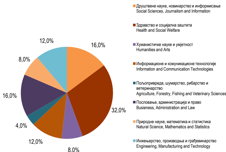
Графикон 2. Доктори наука према научним областима, 2025. Graph 2. Doctors of science by field of study, 2025