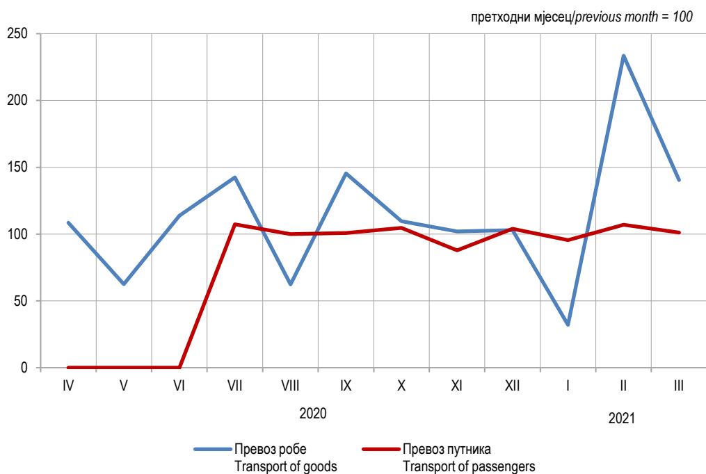
Графикон 2. Мјесечни индекси превоза робе и путника у жељезничком саобраћају, 2020. Graph 2. Monthly indices of railway transport of goods and passengers, 2020