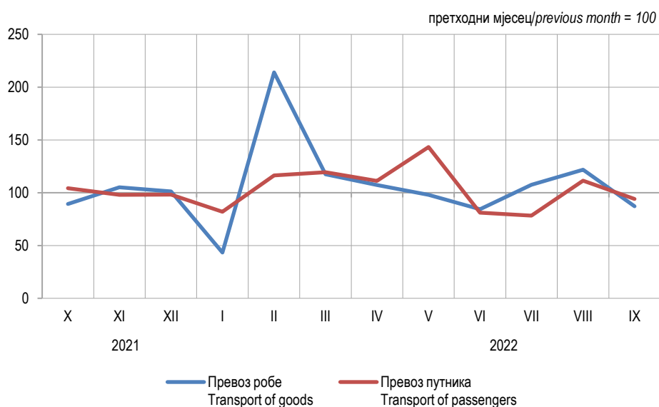
Графикон 2. Мјесечни индекси превоза робе и путника у жељезничком саобраћају Graph 2. Monthly indices of railway transport of goods and passengers