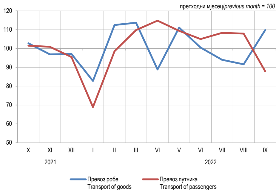
Графикон 1. Мјесечни индекси превоза робе и путника у друмском саобраћају Graph 1. Monthly indices of road transport of goods and passengers