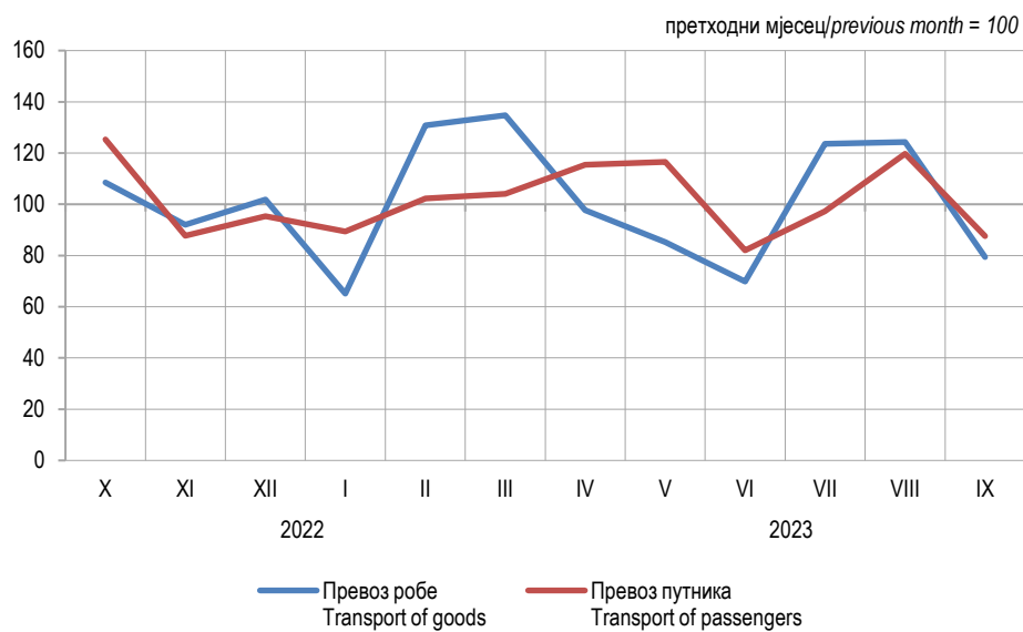
Графикон 2. Мјесечни индекси превоза робе и путника у жељезничком саобраћају Graph 2. Monthly indices of railway transport of goods and passengers