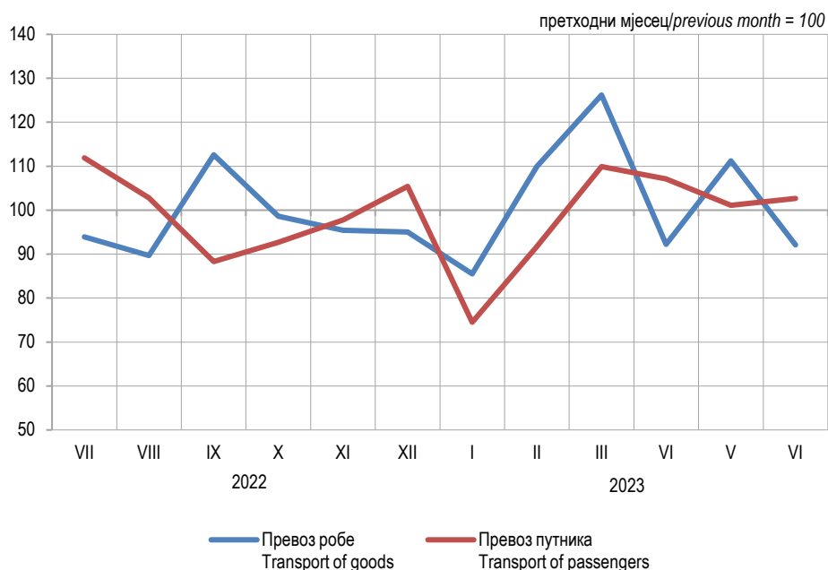
Графикон 1. Мјесечни индекси превоза робе и путника у друмском саобраћају Graph 1. Monthly indices of road transport of goods and passengers