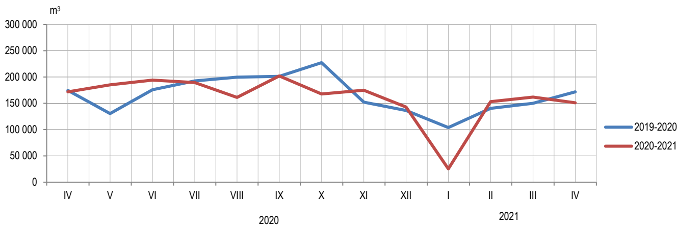
Графикон 1. Производња шумских сортимената у државним шумама по мјесецима Graph 1. Production of forest assortments in state forests by month