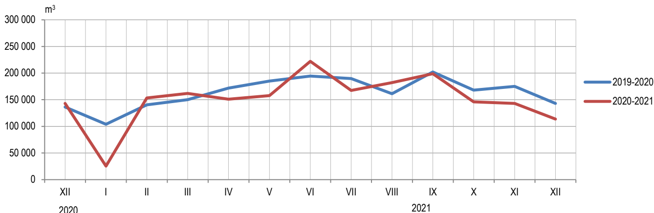
Графикон 1. Производња шумских сортимената у државним шумама по мјесецима Graph 1. Production of forest assortments in state forests by month