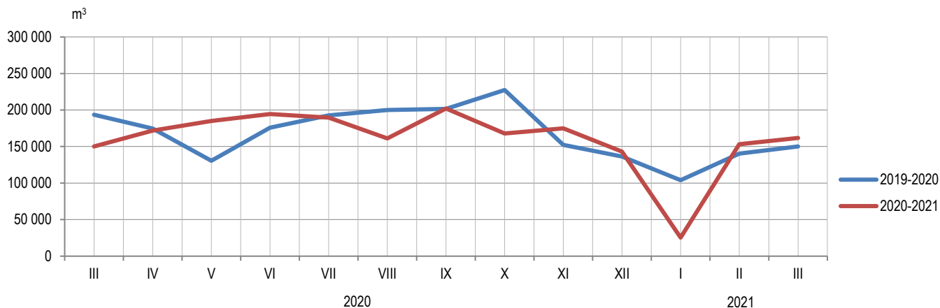
Графикон 1. Производња шумских сортимената у државним шумама по мјесецима Graph 1. Production of forest assortments in state forests by month