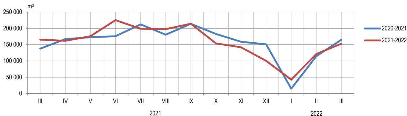
Графикон 2. Продаја шумских сортимената у државним шумама по мјесецима Graph 2. Sale of forest assortments in state forests by month

Припрема саопштења: Данијела Савановић - Вебер e-mail: danijela.savanovic@rzs.rs.ba