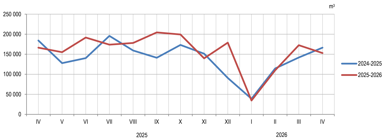
Графикон 2. Продаја шумских сортимената у државним шумама, по мјесецима Graph 2. Sale of forest assortments in state forests, by month

Припрема саопштења: Данијела Савановић - Вебер e-mail: danijela.savanovic@rzs.rs.ba