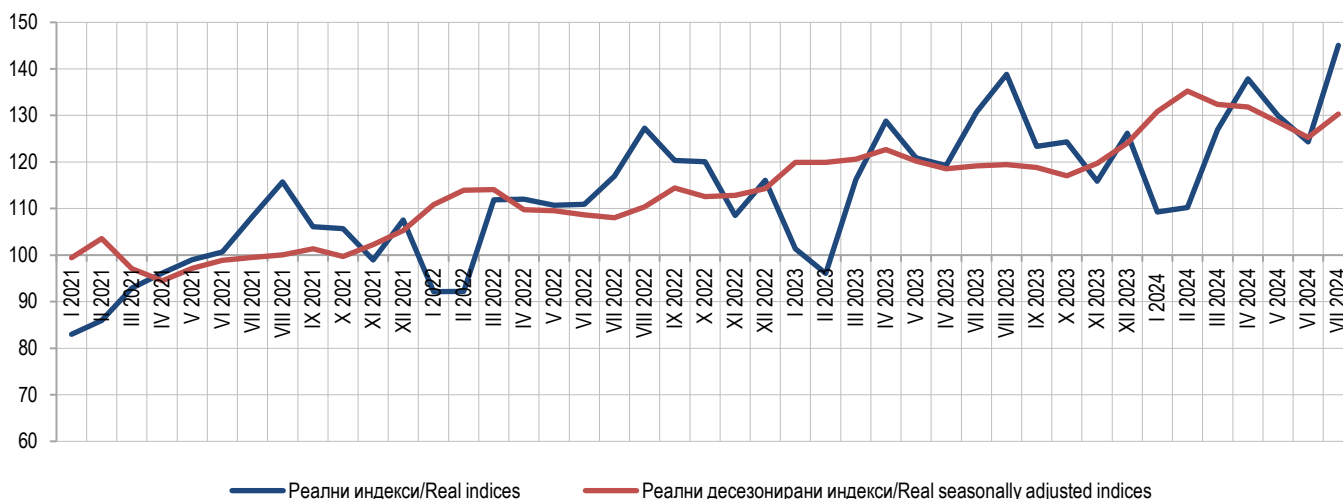
Графикон 1. Серија реалних неприлагођених и реалних десејонизираних индекса, 2021=100 Graph 1. Series of real non-adjusted and real seasonally adjusted indices, 2021=100

Turnover refers to the value of goods sold and services performed during the reference month. Turnover does not include value added tax (VAT).